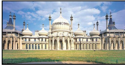
The Royal Pavilion, Brighton