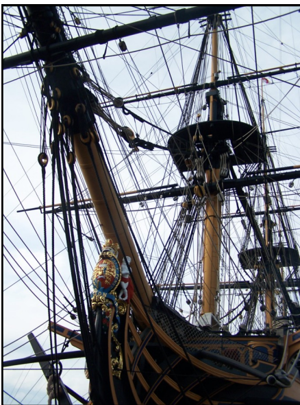
Proue du HMS Victory (Her Majesty Ship)

Oula ! Tout ça ! Voilà une semaine bien chargée ! Mais qu'ont-ils préféré ?