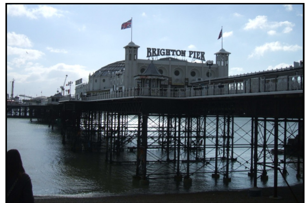
The Brighton Pier

Navire du célèbre Amiral Nelson, dans lequel il trouva la mort lors de la bataille de Trafalgar, qui opposa les Anglais aux Français (alliés aux Espagnols).